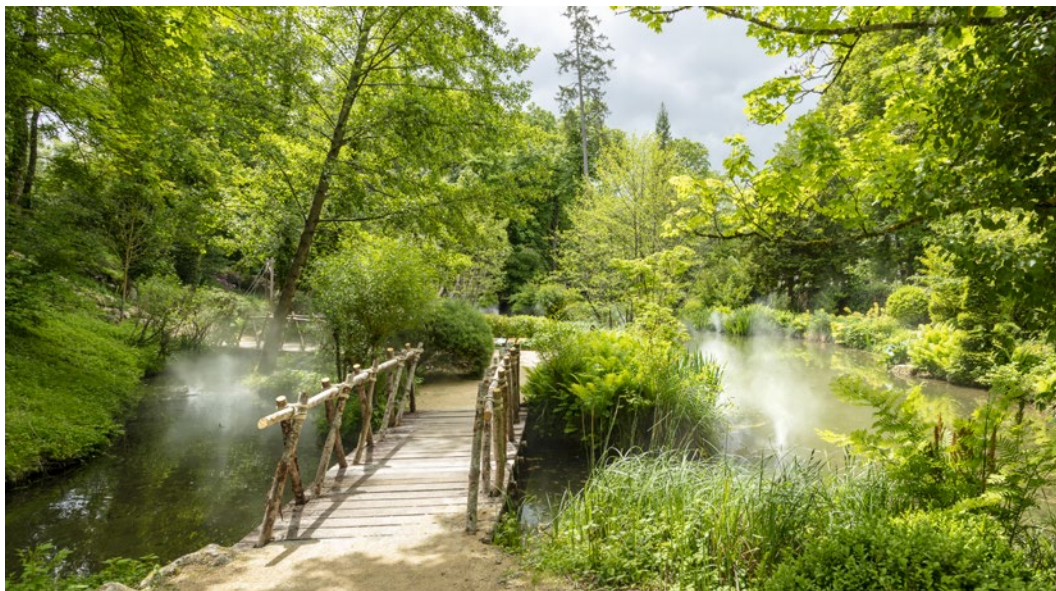
Le Jardin de Léonard