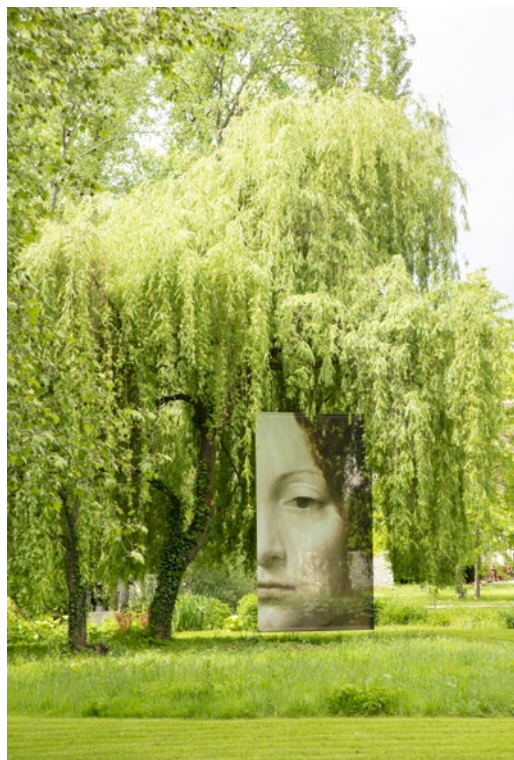
Le portrait de Ginevra de' Benci

Depuis 2003, le parc invite à découvrir quelque 20 maquettes géantes d'inventions de Léonard de Vinci et 40 toiles translucides de deux mètres de haut reprenant ses tableaux et ses dessins majeurs.