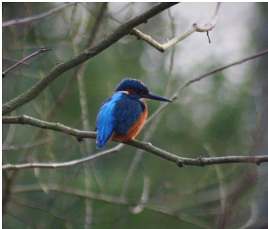
Martin pêcheur dans le parc du Clos Lucé

Conçu comme une passerelle temporelle entre savoirs anciens et problématiques actuelles, le parc déploie sur ses sept hectares 982 arbres dont 23 classés remarquables: platanes, séquoias, charmes, sophoras, hêtres, marronniers, cyprès Leylan, tilleuls et pins noir.