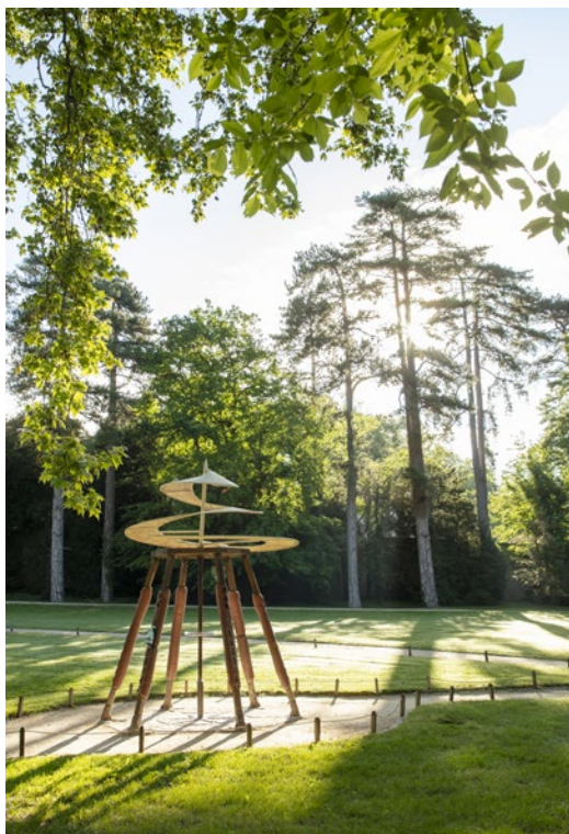
La vis aérienne