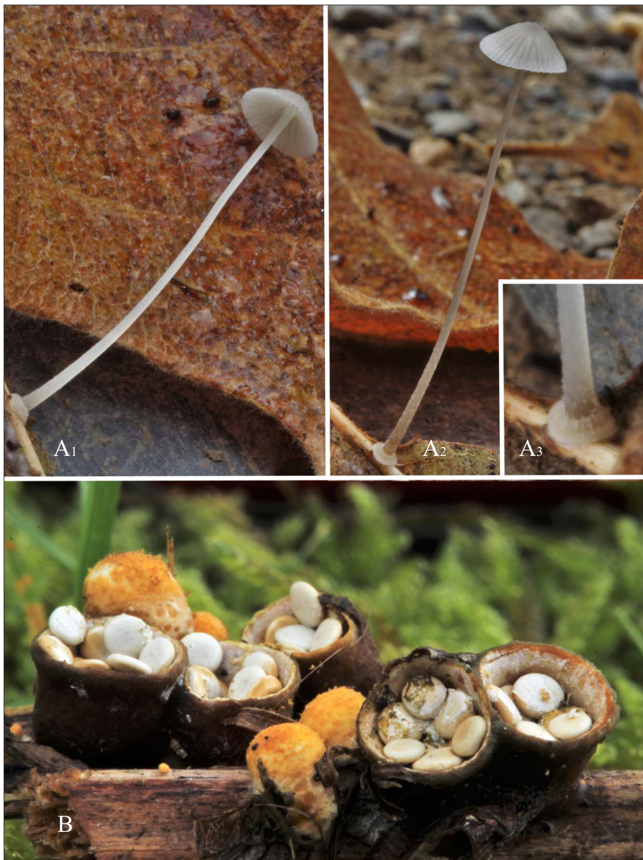
Fig. 5 : A- Mycena stylobates (Pers.) P. Kumm (FA 4110), B- Crucibulum laeve (Huds.) Kambly (FA 4115).