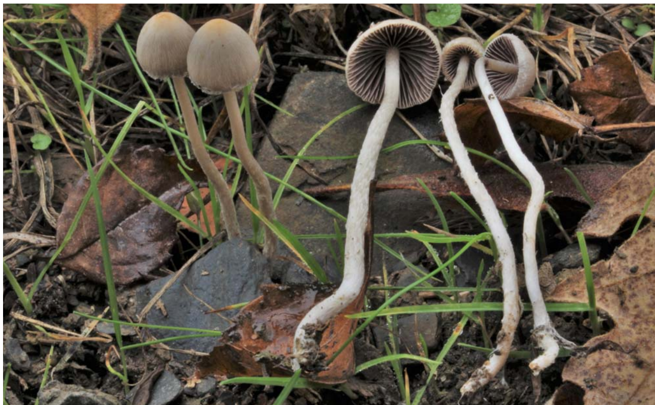
Fig. 1 : Psathyrella orbicularis (Romagn.) Kits van Wav. (FA 4106)