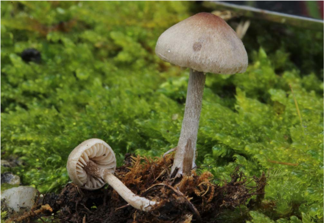
Fig 4 : Sagaranelia tylicolor (Fr.) V. Hofst., Cléménçon, Moncalvo & Redhead (FA 4114).