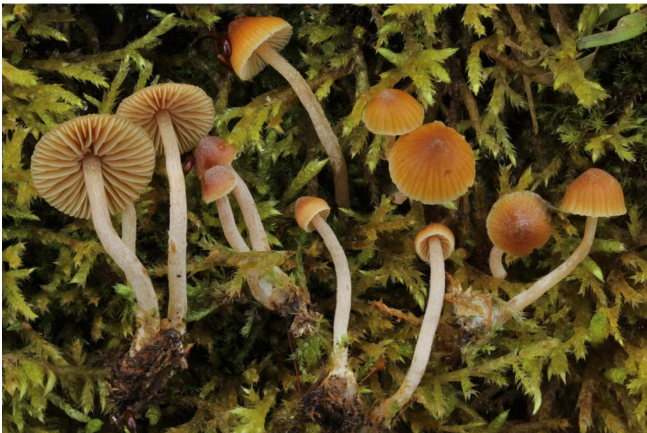
Fig 2 : Galerina discreta E. Horak, Senn-Irlet, Curti & Musumeci (FA 4115).