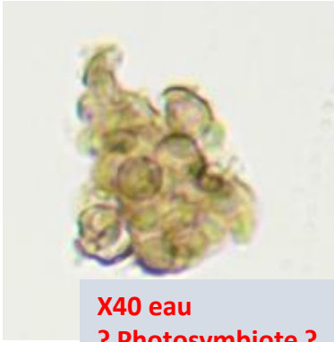
X40 eau ? Photosymbiote ?