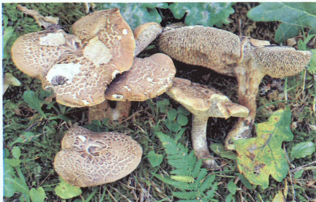
Sarcodon quercinofibulatum (holótipo).

especies de sombrero escamoso, que crecen, como en nuestro caso, bajo fagáceas, carecen de hifas fibulíferas. Conviene destacar que, en muchos casos, la observación de este tipo de hifas al microscopio óptico, no resulta nada fácil. Pero precisamente en nuestro caso, ocurre al revés, ya que no se trata de asegurar la ausencia de estas hifas, sino todo lo contrario, de constatar su presencia, que lo es en abundancia y de forma muy visible en todas las partes del carpóforo.