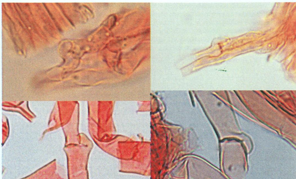
Fig. 1- Sarcodon quercinofibulatum (holótipo). Hifas fibulíferas.